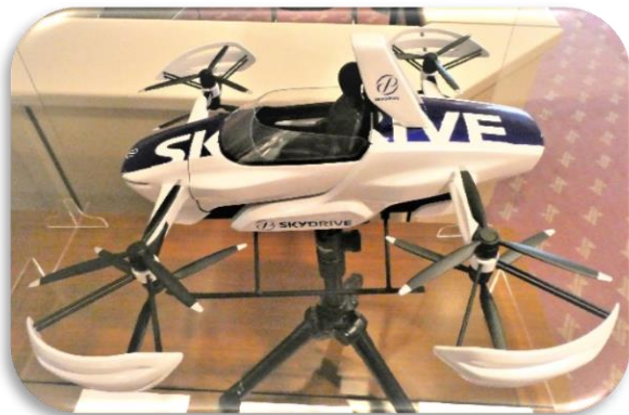
～ 模型が展示されました ～