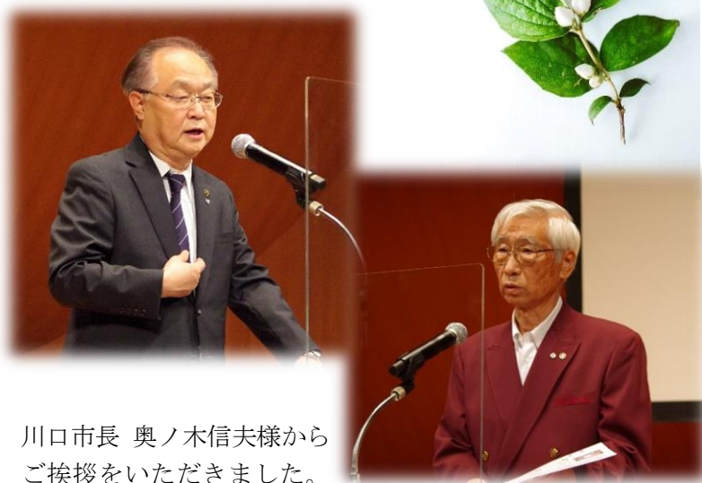
川口市長 奥ノ木信夫様から ご挨拶をいただきました。