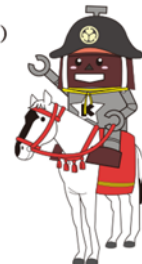
「川口市マスコット「きゅぼらん」