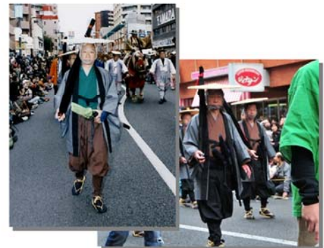
以前の御成道祭りでは 所長も参加しました。