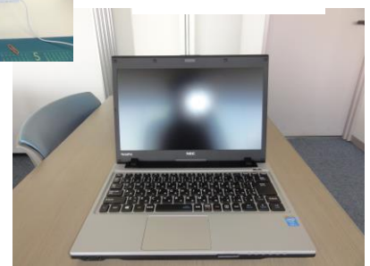
←ノート PC とモニターの 2画面で業務を 行えます