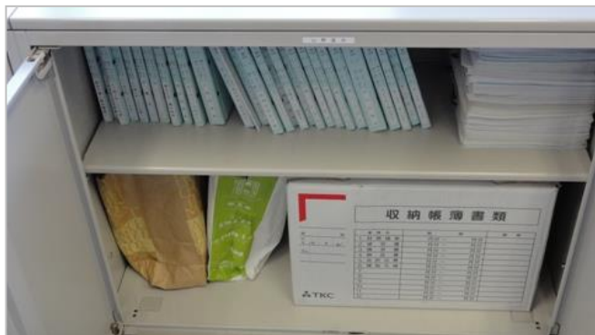
評価の良いキャビネット