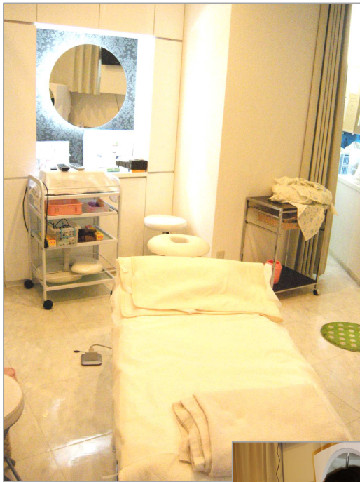
メディカルエステ室

所員 私はまだ乳がん検診を受けたことがありません。マンモグラフィは痛いとよく聞くので尻込みしていましたが、こういう痛みに配慮してくださる医院で乳がん検診を受けたいと思いました。